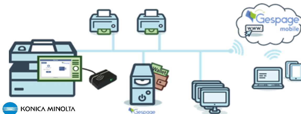
Schéma d'une configuration réseau

Grâce à des boutons d'accès rapide aux fonctions d'impression, scan et de copie, l' eTerminal Konica Minolta rend l'utilisation du MFP plus facile, ergonomique et surtout plus productive à l'usage. D'un simple clic, l'utilisateur interagit avec les documents qu'il souhaite copier, imprimer ou scanner et cela dans le respect de confidentialité et de la réglementation RGPD.